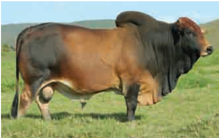
Die bul TLM02-12, hoofstoetbul in die Tambaraine-kudde

“Daar is dus verskillende opsies om te volg. Jy kan speenkalwers vir die voerkraal produseer of jy kan sy gehardheid gebruik om die nismark vir organiese vleis te bedien.”